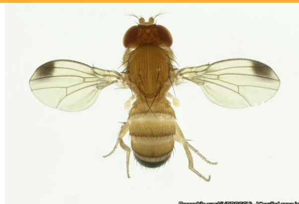
Drosophila suzukii (DROSSU) - https://pde.ppp.it

Na parcela de mirtilos em Angra (Fig. 1; Quadro 1) registou-se um decréscimo das capturas. No pomar de citrinos em Biscoitos (Fig. 2; Quadro 2), das três diferentes armadilhas ensaiadas aquela mais eficaz foi a com Drosalure.